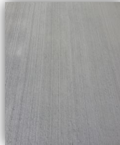
- Balayage / broyage