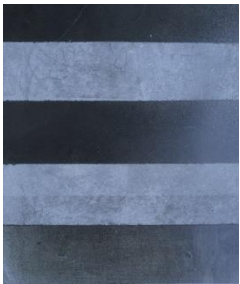
- Consolidation provisoire des surfaces glissantes