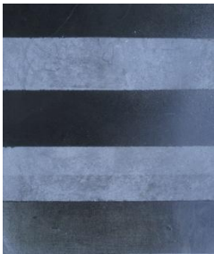
- Provisorische Rutschsicherung